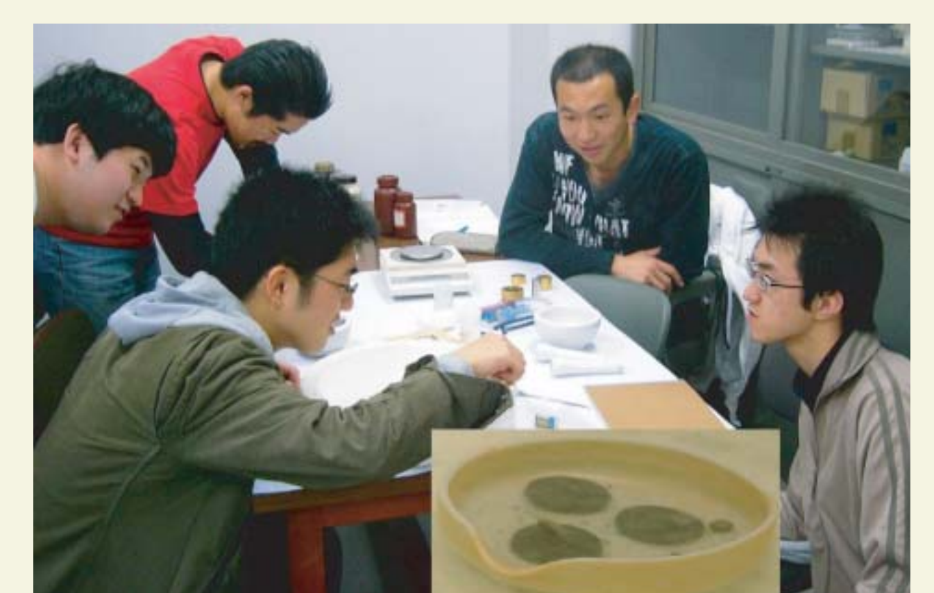
極低温で測る超伝導現象