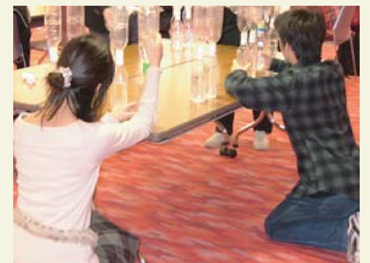
ペットボトルを使って調べる振動現象