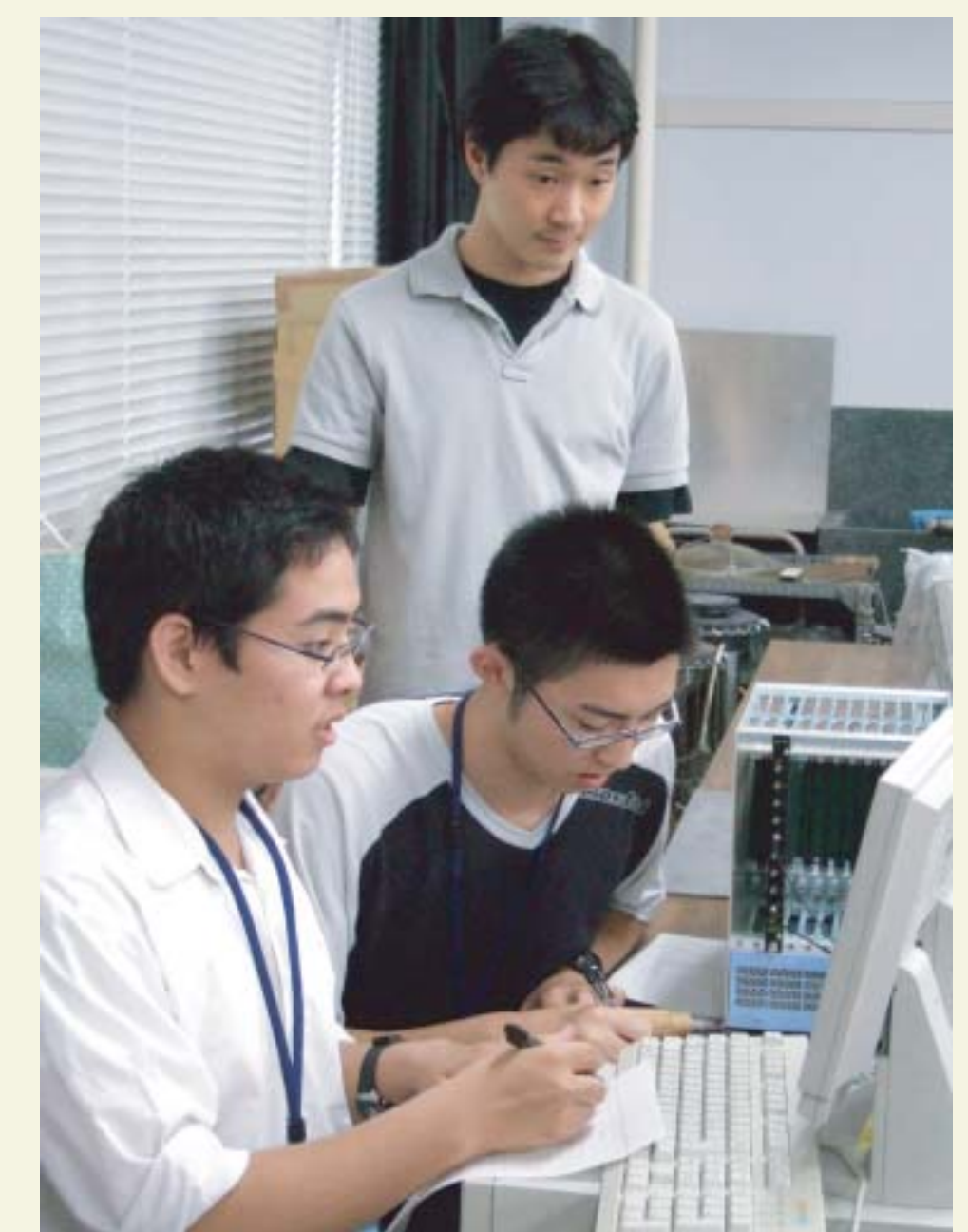
昨年度の実験・実習風景